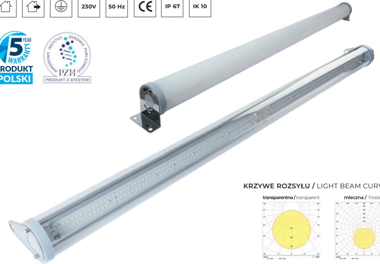
KRZYWE ROZSYŁU / LIGHT BEAM CURVES: