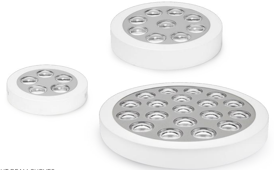
KRZYWE ROZSYŁU / LIGHT BEAM CURVES: