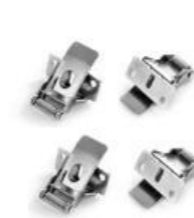
KLIPS Z LINKĄ/ FASTENING SPRINGS