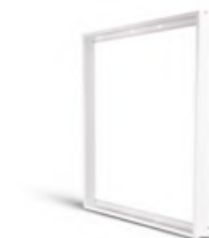
RAMKA NT/ SURFACE FRAME